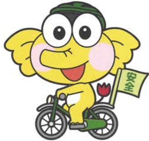
<自転車バージョン>