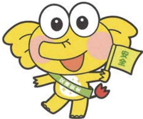
<反射タスキバージョン>