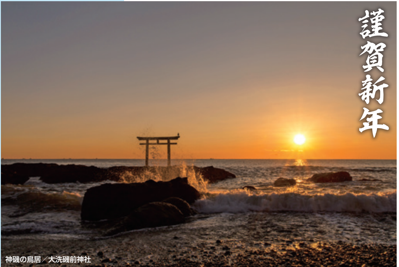
神磯の鳥居 / 大洗磯前神社

小 木 小 土 堀 枝 渡 市 塚 久 小 洪 入 石 谷 長 橋 大 丹 鈴 藤 菊 秋 海 照 平 田 川 村 倉 田 江 辺 塚 本 田 坂 谷 江 山 川 島 本 場 木 田 池 山 野 沼 塚 山 一 藤 邦 武 準 國 不 英 秀 偉 治 康 由 晃 誠 一 安 保 信 藤 洋 尚 東 成 一 義 利 一 守 男 夫 隆 世 博 雄 人 男 一 延 壽 忠 郎 良 彦 裕 夫 男 一 二 湖 (取) (古) (常) (結) (桜) (下) (筑) (つ) (石) (土) (稲) (牛) (龍) (行) (神) (鹿) (銚) (高) (日) (大) (太) (大) (那) (ひ) (た) (ち) (な) (か) (水) (戸) 境 く ケ 高 日 大 太 大 那 (ひ) (た) (ち) (な) (か) (水) (戸) 手) (河) (総) (城) (川) (妻) (西) (ば) (岡) 浦 敷 久 崎 方 栖 嶋 田 萩 立 子 田 宮 珂 (か) (水) (戸)